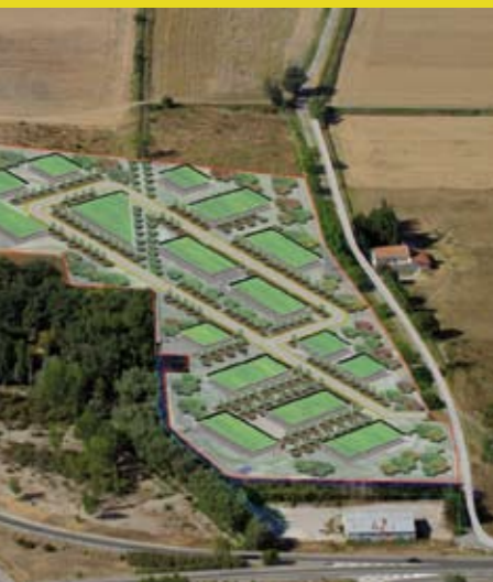
Technoparc des Grandes Terres